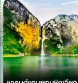
แกรนด์แคนยอนชิงเจียง