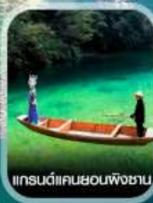
แกรนด์แคนยอนผิงซาน

✈️ คอมพิวเตอร์ออกเดินทาง ทุกพีเรียด 2 ท่านขึ้นไป