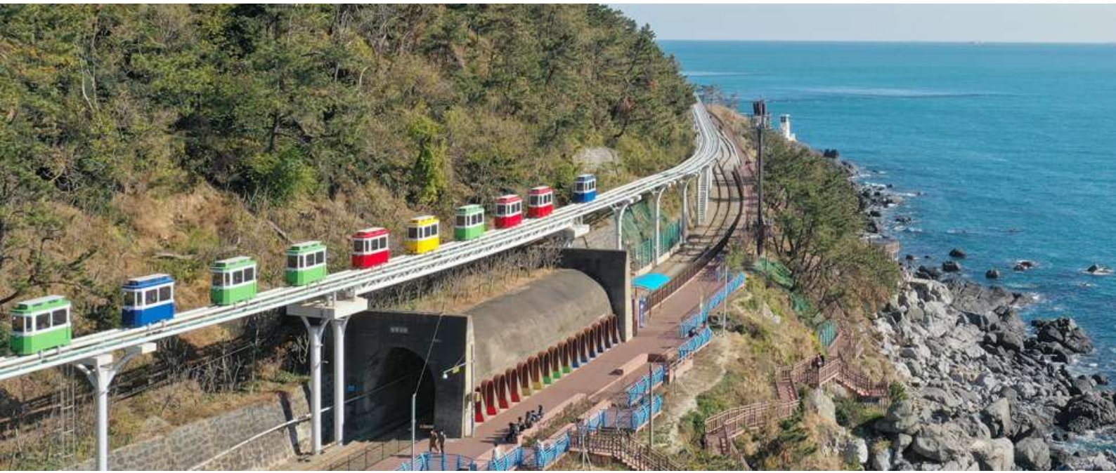
โดยเฉพาะช่วงเย็นที่พระอาทิตย์ตกดิน จะเห็นวิวที่โรแมนติกเป็นอย่างมาก

แวะเดินเล่น ถนนหาดแฮอนแด หนึ่งในชายหาดที่สวยงามและมีชื่อเสียงที่สุด ตั้งอยู่ใจกลางเมืองปูซาน ด้วยหาดทรายขาวละเอียด ทะเลสีครามใส และวิวเมืองที่สวยงาม ทำให้หาดแฮอนแดเป็นจุดหมายปลายทางยอดนิยมของนักท่องเที่ยวทั้งชาวเกาหลีและชาวต่างชาติ จากชายหาดสามารถมองเห็นตึกระฟ้าและวิวเมืองปูซานได้อย่างชัดเจน