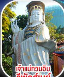
เจ้าแม่กวนอิม รีพัสลีย์