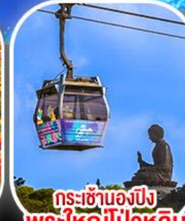
กระเช้าเองปีง พระใหญ่โป่วหลิน