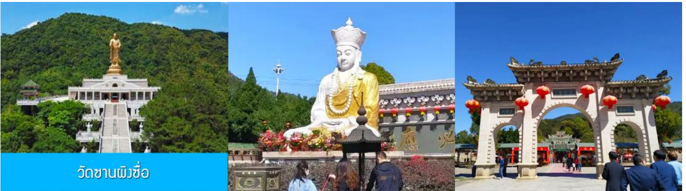
วัดซานผิงซื่อ

หลังอาหารนำท่านเดินทางโดยรถบัสสู่ เมืองจางโจว 漳州 (ระยะทาง 159 กม.ใช้เวลาเดินทางราว 2 ชั่วโมงเศษ)