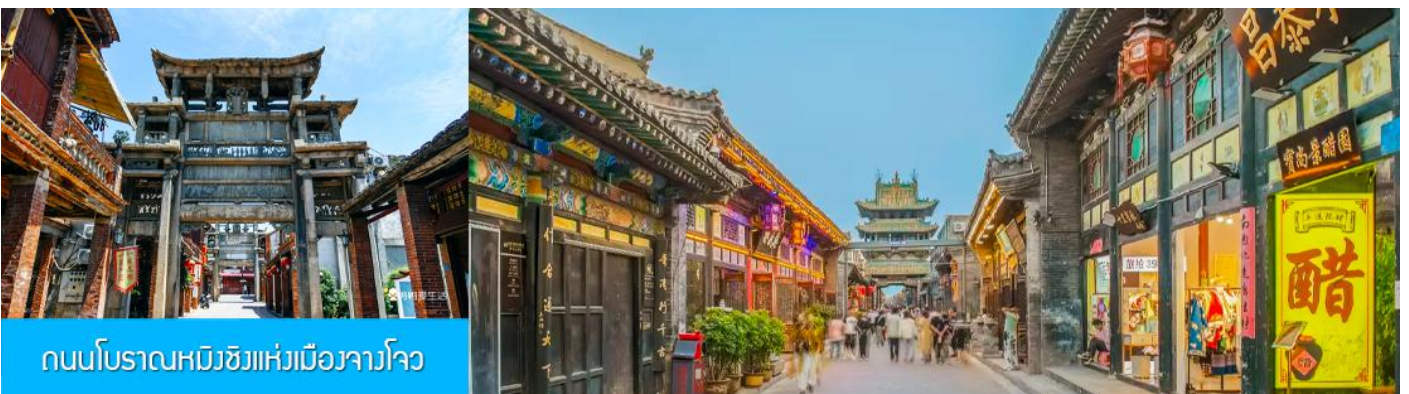
ถนนโบราณหมิงชิงแห่งเมืองจางโจว