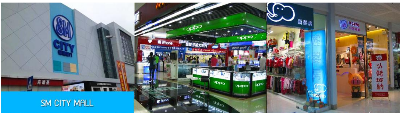
SM CITY MALL

เที่ยง รับประทานอาหารกลางวัน ณ ภัตตาคาร (14) จากนั้นนำท่านสู่ SM CITY MALL ให้ท่านมีเวลาอิสระเพื่อเดินชมและเลือกซื้อสินค้าหลากหลายภายในศูนย์การค้าขนาดใหญ่ใจกลางเมืองเซี่ยะเหมิน หรือท่านสามารถเลือกซื้อสินค้าเมืองราคาพิเศษจากห้าง WALMART ซึ่งอยู่ติดกับห้าง SM CITY MALL