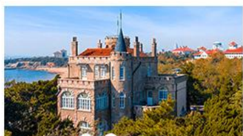
ป่าตึกวน

พระราชวังฤดูร้อน - วิวเมืองซิงเต่า รถไฟความเร็วสูง - ภูเขาเหลาซาน กำแพงเมืองจีนด่านจวิยงกวน - ป่าตึกวน พักโรงแรมระดับ 4 ดาว - ไม่หลงร้านช้อปปิ้งพิเศษ เปิดปักกิ่ง, หม้อไฟซีฟู้ด