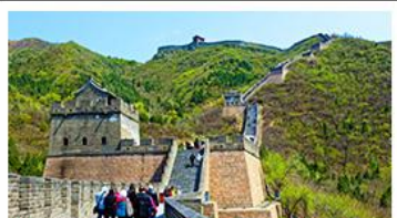
กำแพงเมืองจีนด่านจวิยงกวน