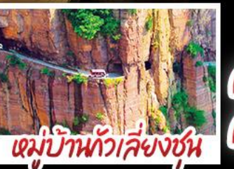
หมู่บ้านกัวลี้ยงชุน