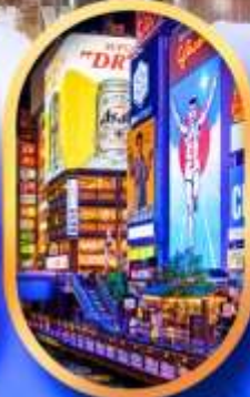
ย่านชิบโฮบาชิ