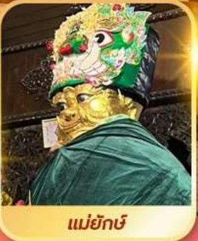
แม่ยักษ์