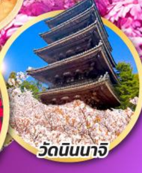
วัดนินนาจิ