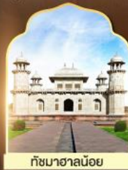
ถ้ำมาฮาลีนอย