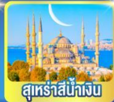
สุเหร่าสีน้ำเงิน