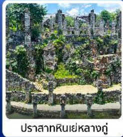
ปราสาทหินเย่หลางกู่

● ไฮไลท์ น้ำตกหวงกั๋วซู่ น้ำตกที่ใหญ่ที่สุดของจีน แหล่งท่องเที่ยวระดับ 5A ชมความสวยงาม หมู่บ้านวูเจียงจ้าย หมู่บ้านจีนโบราณ