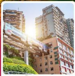
รถไฟฟ้าลูตีก