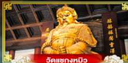
วัดเขangkมัว