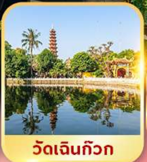
วัดเงินทิวาก