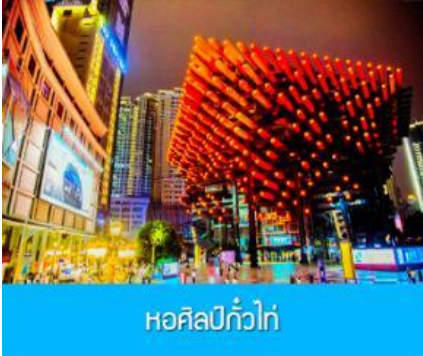
หอศิลป์กั๋วไท่

รับประทานอาหารกลางวัน ณ ร้านอาหารพื้นเมือง (8)