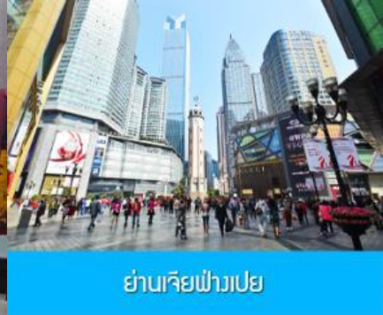
ย่านเจียฟางเปย