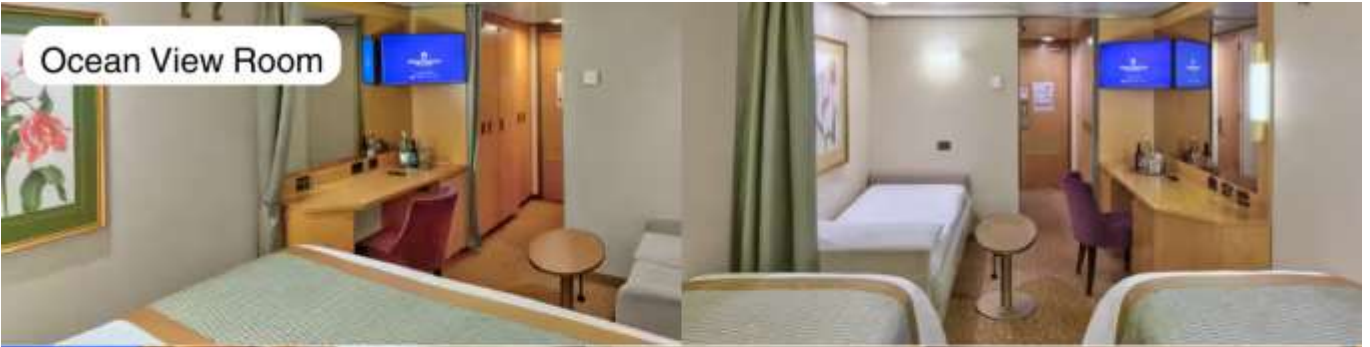
Ocean View Room