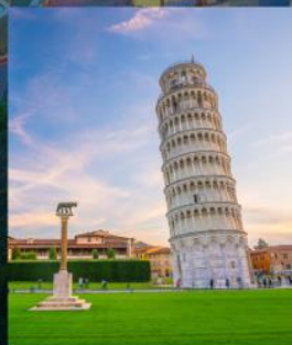
TOWER OF PISA