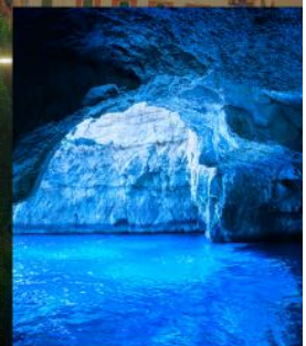
BLUE GROTTO CAPRI