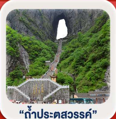
"กำประตูดวงสวรรค์"