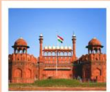
♥♦♦ Agra Fort