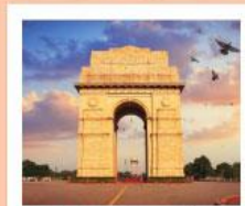
♥♦♦ India Gate