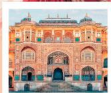
♥♦♦ Amber Fort