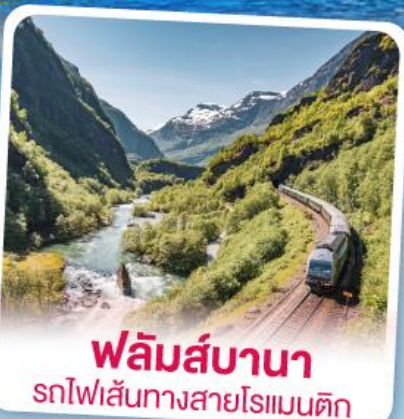
พหลิมส์บานา รถไฟเส้นทางสายโรเมนติก