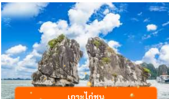
เกาะไก่อ๋น

เที่ยง บริการอาหารกลางวัน ณ ภัตตาคาร พิเศษ ... เมนูซีฟู้ดบนเรือ