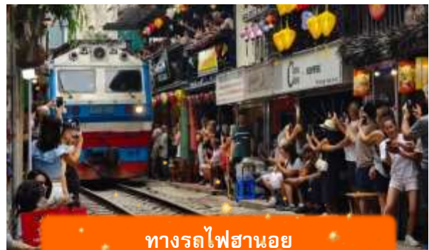
ทางรถไฟฮานอย

เช้า บริการอาหารเช้า ณ ห้องอาหารของโรงแรม นำท่านเดินทางสู่ วัดเจ็ญกั๊ก วัดริมทะเลสาบที่เก่าแก่ที่สุดในฮานอย สงบ สวย และ สะท้อนวัฒนธรรมเวียดนามได้อย่างลึกซึ้ง หลังจากนั้นนำท่านเดินทางสู่ ทางรถไฟฮานอย เป็นแหล่งท่องเที่ยวที่ได้รับความนิยมในกรุงฮานอย ประเทศเวียดนาม จุดเด่นของที่นี่คือ ทางรถไฟที่วิ่งผ่านย่านชุมชนที่อยู่อาศัย ทำให้เกิดภาพวิถีชีวิตที่แปลกตาและเป็นเอกลักษณ์ ท่านสามารถทดลองชิมกาแฟแท้ๆจากเวียดนามได้ที่นี้ อาทิ กาแฟนมเวียดนาม ที่มีความเข้มข้น กาแฟไข่มุกรวมหอมละมุน หรือกาแฟเกลือที่ทำให้ความรู้สึกแปลกแต่อร่อย อย่างบอกไม่ถูก (ไม่รวมค่าเครื่องดื่ม)