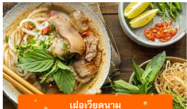
เฟอเวียดนาม

เที่ยง บริการอาหารกลางวัน ณ ภัตตาคาร พิเศษ ... เมนูเฟอไก่เวียดนาม ได้เวลาอันสมควรนำท่านเดินทางเข้าสู่ สนามบินนอยไบ เพื่อเดินทางกลับประเทศไทย 15.55 นำท่านเดินทางสู่ สนามบินสุวรรณภูมิ ประเทศไทย เที่ยวบินที่ VN619 (บริการอาหาร และเครื่องดื่มบนเครื่อง)