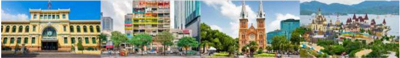
ไบรณีย์กลางโฮจิมินห์