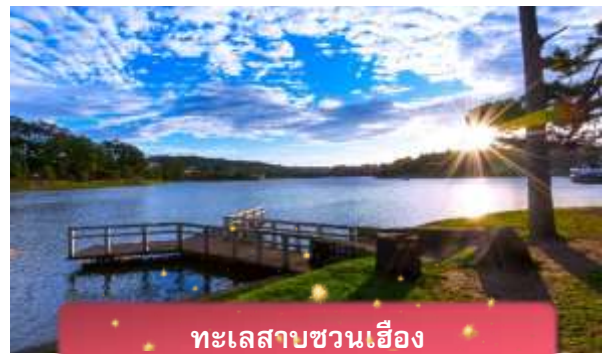
ทะเลสาบชวนเอียง

ที่พัก The Western Hill ระดับ 4 ดาวหรือเทียบเท่า