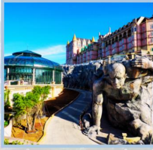
โซน Eclipse Square