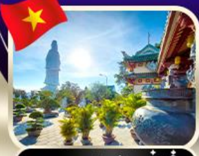
ขอพรกวณอิมวัดหลันอึ้ง