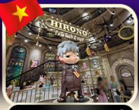
POPMART บานาฮิลล์