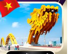
สะพานมังกร ดานัง