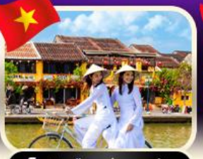
เช่าจักรยานเมืองเก่าฮอยอัน