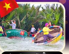
ล่องเรือกระด้งที่ทาน