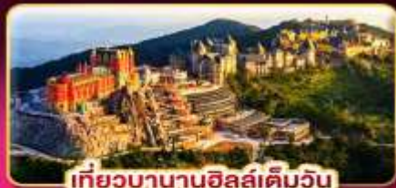
เที่ยวบานาฮิลล์เต็มวัน

ล่องกระทงขามดำคืนที่ฮอยอัน ไฟล์ทสวย บินเช้า-กลับเย็น