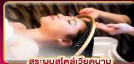
สระผมสไตล์เวียดนาม