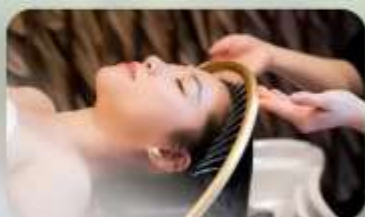
สระผสมสโตร์เวียดนาม