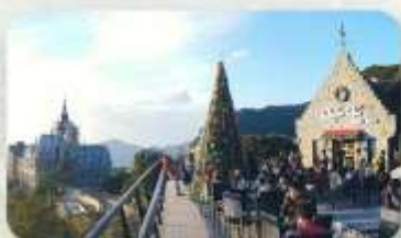
Gio Cafe Tam Dao