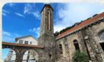
Tam Dao Stone Church