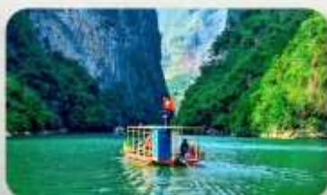
ล่องเรือ Ma Pi Leng Pass

YEN BIEN LUXURY 4* หรือเทียบเท่ามาตรฐานเวียดนาม