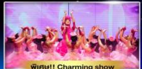
พิเศษ!! Charming show