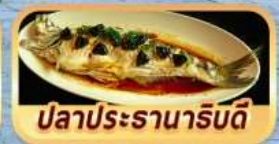
ปลาประรานาธิบดี