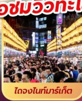
ไถจงไนท์มาร์เก็ต