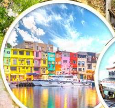
ท่าเรือสายรุ้ง