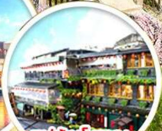
หมู่บ้านโบราณ จิวเฟิน