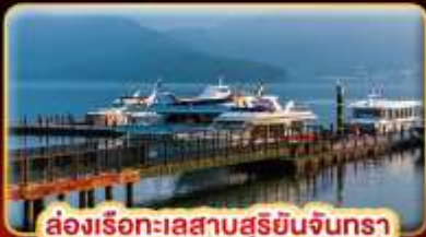
ล่องเรือทะเลสาบสุริยขึ้นจินกรา

บ๊ี้แด้ม STREET FOOD แบบจุใจ ขอความรักวัดแดงชาแน