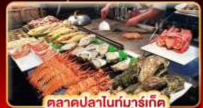
ตลาดปลาไถ่มาร์เก็ต