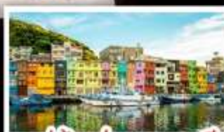
หมู่บ้านประมงหลากสี