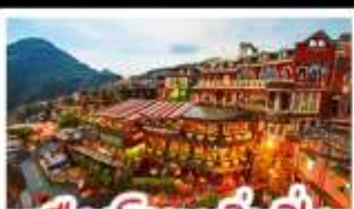
เมืองโบราณจิวเฟิ่น

ฟาร์มแกะชิงจิง - ทะเลสาบสวี่นจินตรา จิวเฟิ่น - หมู่บ้านประมงหลากสี - ไทเป 101 หมู่บ้านสายรุ้ง - ตลาดล่าหู่ & ซีเหมินติง ปลาประ-ธานธิบดี - เขียวหลงเป่า