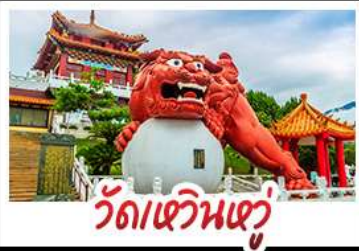
วัดเขวินเฮวี่

อาลีซาน - ทะเลสาบสุริยอันจินตรา - ไทเป101 วัดหวินหัว - อนุสรณ์สถานเจียง ไคเชก วัดหลงชาน - ตลาดกลางคืนซีเหมินติง เมนู หม้อหนึ่งจิวพรรคตี้ - เชี่ยวหลงเปา - ชาบูไต้หวัน