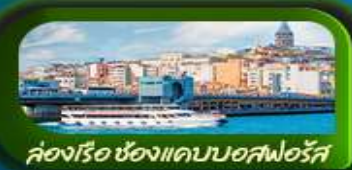
ช่องเรือ ซองแควบอสฟอรัส

📅 เดินทาง 02-10 เม.ย. 69 / 30 เม.ย. - 08 พ.ค. 69