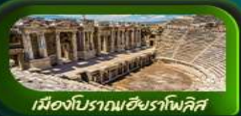
เมืองโบราณเฮียราโพลิส

อิสตันบูล ปามุกคาเล คัปปาโดเกีย ERCIYES MOUNTAIN SKI