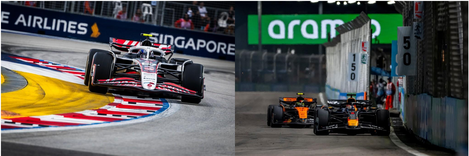
ชม รอบ SPRINT RACE + QUALIFYING

**เดินทางด้วยตนเอง เข้าร่วมงาน FORMULA 1 SINGAPORE GRAND PRIX 2026**