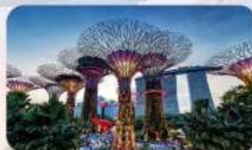
Gardens by the Bay