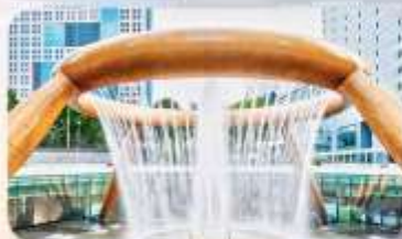
Fountain of Wealth