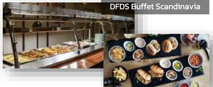
DFDS Buffet Scandinavia

ค่ำ บริการอาหารค่ำแบบบุฟเฟ่ต์ ณ ห้องอาหารของเรือ DFDS