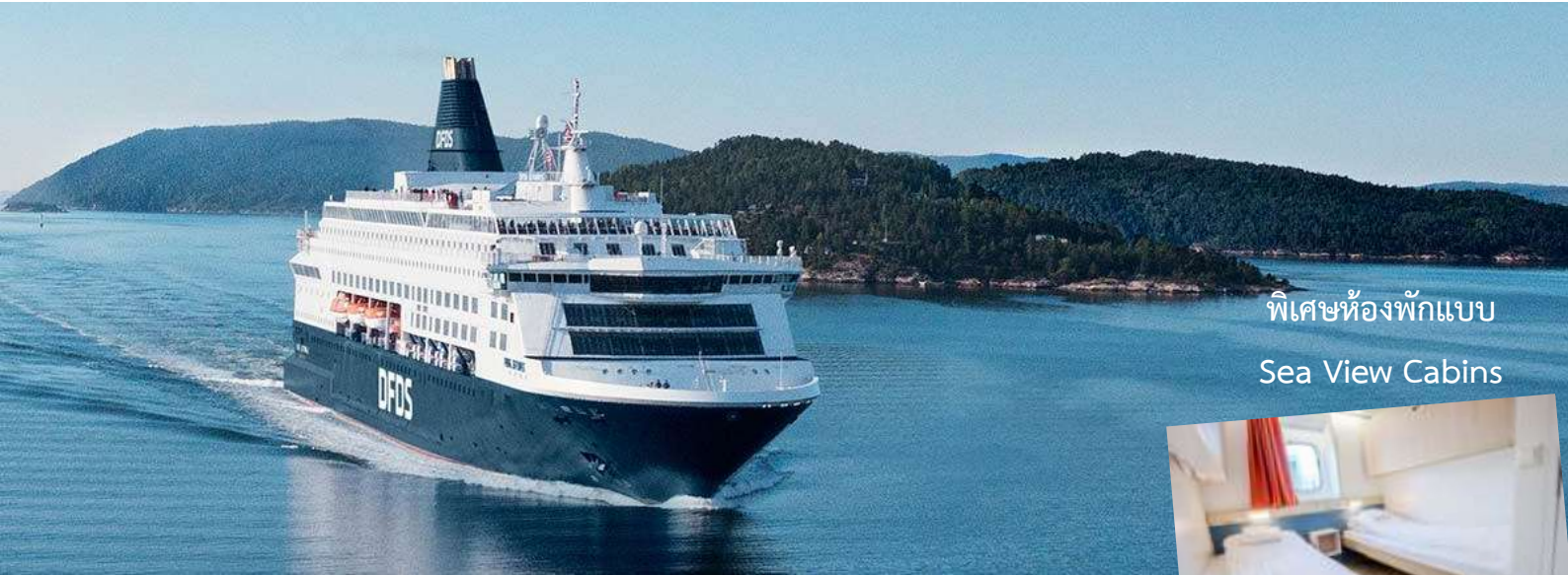
พิเศษห้องพักผ่อน Sea View Cabins