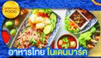
อาหารไทย ในเดนมาร์ก