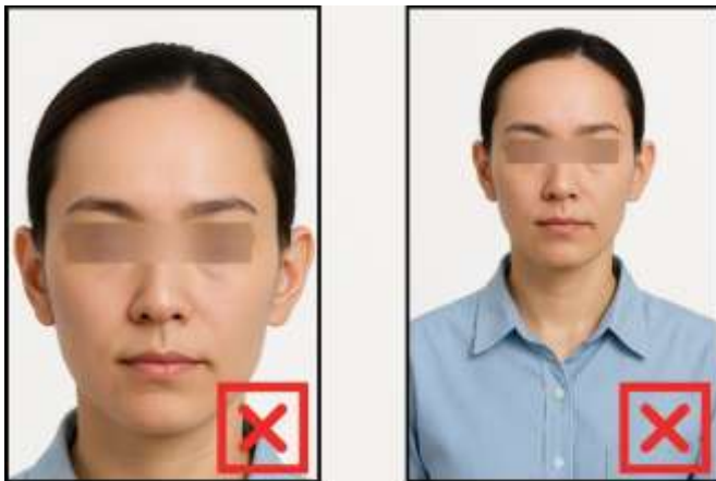
รูปที่ไม่ได้ขนาด ตามที่สถานทูตกำหนด