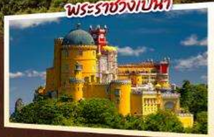
พระราชวังปนา

เข้าชมความงดงามของ พระราชวังอาลิบร่าและพระราชวังเปนา