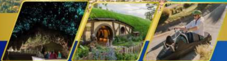
ถ้ำหอนเรื่องแสง