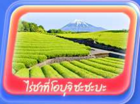
ไร่ชาที่โอบุจิ ชะชะบะ

Highlight สัมผัสความเป็นญี่ปุ่น ชมวิวฟูจิที่ ทะเลสาบยามานากะโกะ ศาลเจ้าฟูจิซังเซเนงงน "Unseen" ขอฟรด้วยหัวโซเก้ทำ ที่วัดมัตสึจิยามา โชเดิน ถ่ายภาพวิวไร่ชาที่ โอบุจิ ชะชะบะ ขอฟร วัดอาซากุสะ วัดพระโศกโชคุ ไดบุทสึ เดินเล่น คาวาโกะเอะ Toyosu Senkyaku Banrai ซอปปิงย่านชินจูกุ และห้างไดเวอร์ซิตี