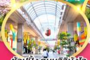
ช้อปปิ้ง ถนนอิชิบังโจ