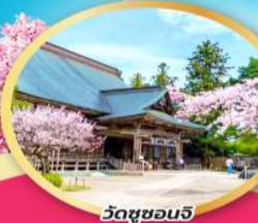
วัดชูซอนจิ