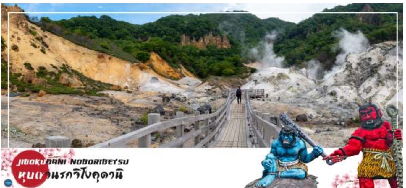
JIGOKUDANI NOBORIBETSU หุบเขานรกจิโกกุดานิ

วันที่สอง ทำอากาศยานนิวซีโตเสะ สอกโกโต – เมืองโนโบริเบทสึ – หุบเขานรกจิโกกุดานิ – เมืองฮาโกดาเตะ – ฮาโกดาเตะในทิว