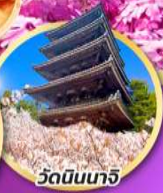
วัดนินนาริ