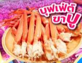
บุฟเฟ่ต์ ชาบู