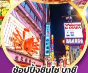
ช้อปปิ้งชินไซ บาชิ