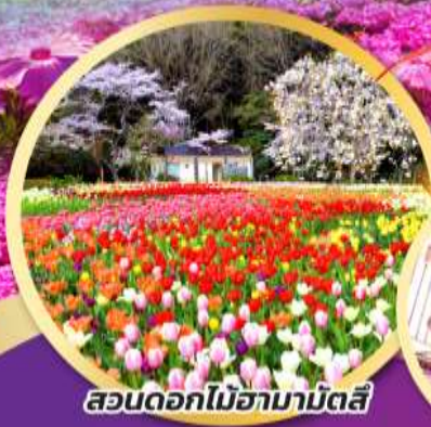
สวนดอกไม้ฮามามัตสึ