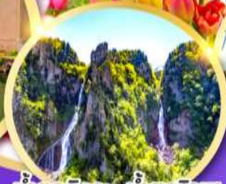
น้ำตกทิงกะ-น้ำตกริวเซ