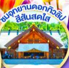
ชมอุทยานดอกทิวลิป สีสันสดใส