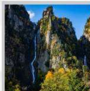
"GINGA & RYUSEI FALLS"

สัมผัสความสวยงามของดอกไม้ "ดอกทิวลิป ณ สวนคะมิยูเบตสึ" ที่มีมากกว่า 120 สายพันธุ์ เพลิดเพลินกับ "ถ้ำน้ำแข็งไอซ์ พาวีเลียน" ที่มีหยดน้ำแข็งรูปร่างสวยงามต่างๆ ที่อุณหภูมิ -20 องศา "ฟาร์มสุนัขจิ้งจอกฮอกไกโด" ฟาร์มสุนัขจิ้งจอกแห่งเดียวของเกาะฮอกไกโด สายพันธุ์ท้องถิ่นคือ สายพันธุ์ Ezo red fox ชมกระท่อมไม้หลังน้อยในดินแดนเทพนิยาย ณ "หมู่บ้านนิงเกิลเทอร์เรซ" จำหน่ายสินค้าจำพวกงานฝีมือต่างๆ นำท่านขึ้นชมวิวมุมสูง "นั่งกระเช้าภูเขาไฟโมอิวะ" เพื่อชมทัศนียภาพของเมืองซัปโปโรจากมุมสูง ชม "ทุ่งดอกพืชมอส ณ สวนทาคิโนะอุเอะ" ด้วยพรมสีเขียวที่มีพื้นที่ขนาดใหญ่ถึง 100,000 ตารางเมตร