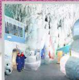
"KAMIKAWA ICE PAVILLION"