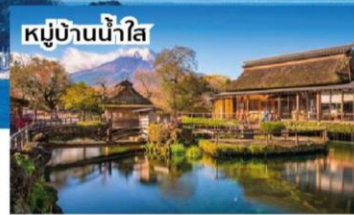
หมู่บ้านน้ำใส