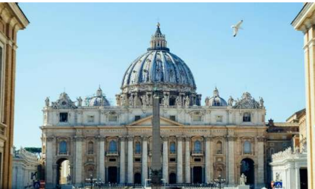
มหาวิหารนักบุญปีเตอร์ ( ST. PETER' BASILICA)

(กรณีมีพิธีด้านใน หรือถ้าหากมีผู้เข้าชมเป็นจำนวนมากจนไม่สามารถเข้าชมได้ทันเวลา ทั้งนี้เพื่อมิให้กระทบต่อกำหนดการท่องเที่ยวอื่นๆ ภายในโปรแกรมทัวร์" อาจจะไม่ได้รับการเข้าชม)