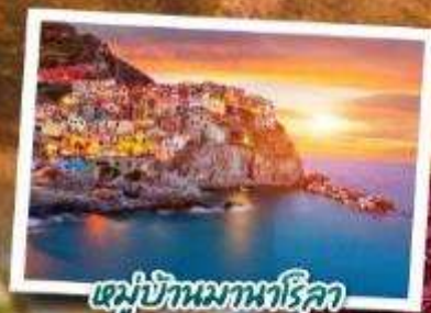
หมู่บ้านมหานทีโรลา