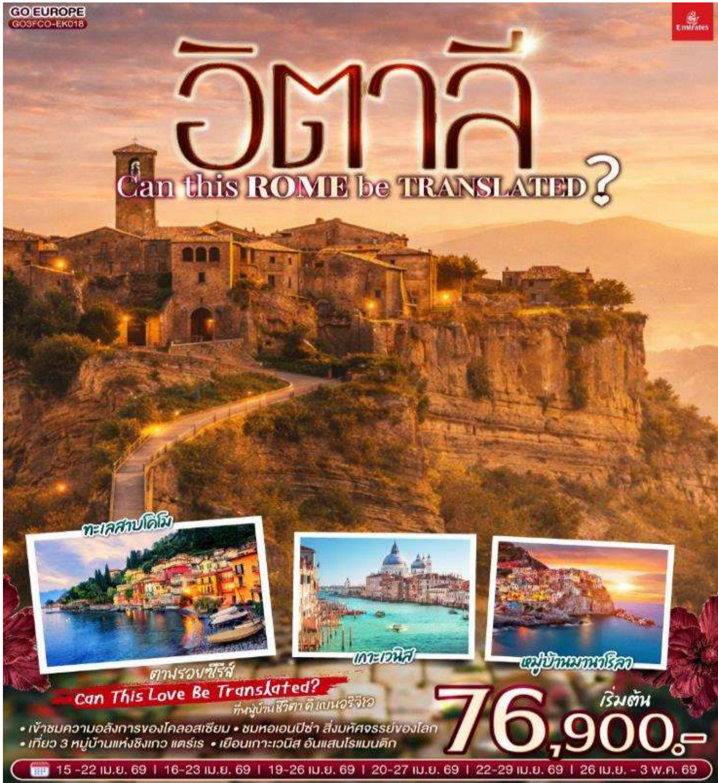
ทะเลสาบคิมี