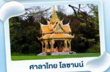
ศาลาไทย ไหลซาน